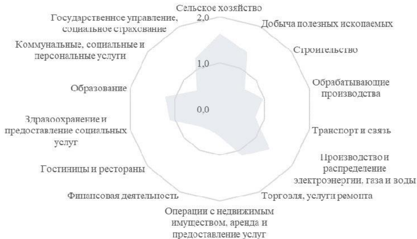
Рисунок 2. Индекс локализации Курской области (2017)